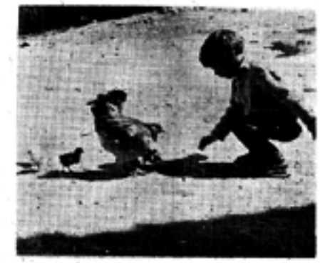
Ἐνα Ἐλληνόπουλο ...φυσιοδίφης