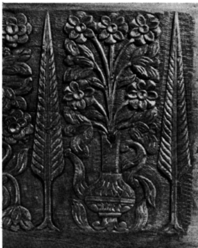
Ξυλόγλυπτη κασέλα με διακόσμηση λουλουδιῶν καὶ κυπαρισσιῶν.

Ἄλλη, πάλι, ποικιλία φυτικοῦ διακοσμοῦ, με ἀπλοϊκὲς παραστάσεις λουλουδιῶν, πού στολίζουν ζουπλοῦμιστὰ ἀγγεῖα, μᾶς παρουσιάζει ἡ ἀγγειοπλαστικὴ τέχνη. Καὶ αὐτές, ἀκόμη, οἱ νησιώτικες στάμνες τοῦ νεροῦ ἔχουν πολύχρωμες διακοσμήσεις με λουλούδια καὶ φύλλα, πού θυμίζουν τὰ κεντήματα, ἀλλὰ καὶ τὴν ἀγάπη τῶν