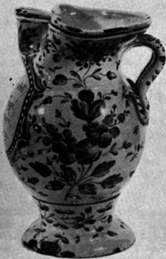
Κεραμικό άνθοδοχείο με φυτική διακόσμηση.

Τὰ χαλκωματένια, κασιπέρινα, ὄρειχάλκινα είδη : τὰ πιάτα, τὰ ταψιά, τὰ κακάβια, τὰ γκιούμια, τὰ θερμάρια, τὰ χαρανιά, τὰ λεγενόμπρικα, τὰ σινιά και τόσα άλλα, με τὰ πλούσια χαρακτὰ συνή-