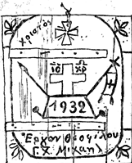
τὸ ἐπίτι μῶθῆσαι ἡμᾶς ἐπὶ. Π.Κ.