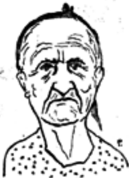
(ἀπὸ τελευταία τῆ φωτογραφία).