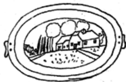
ὁ δῖκος. (ζωγραφιστὸς πρὸς ἡμᾶς).